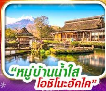
“หมู่บ้านน้ำใส โอชิโนะฮักไก”