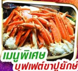
เมนูพิเศษ บุฟเฟต์ซาปูยักษ์

35,999 ราคาเพียง *รวมภาษีมูลค่าเพิ่มแล้ว*