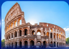
เข็ควินดัง โคลอสเซียม โรม