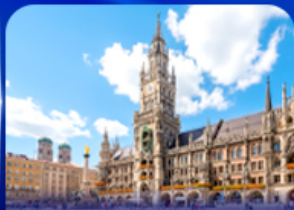
จัตุรัสมาเรียนพลัทซ์ มิวนิก