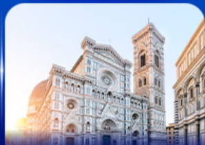
ชมเมืองแห่งศิลปะ ฟลอเรนซ์