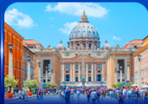
นครรัฐวาติกัน โรม