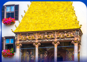
หลังคาทองคำ อินส์บรุค