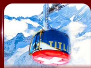
*Optional* นั่งกระเช้าชมวิวกิตติส