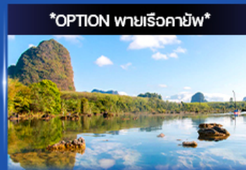
*OPTION พายเรือคายัค*