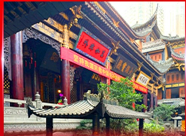
วอพรวัดหลัวจัน ฉงซิ่ง