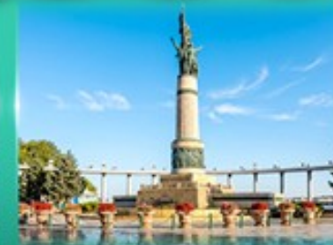
อนุสาวรีย์นิ่มหง