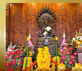
ศาลเจ้าปู่ชิงสิงนาคราช