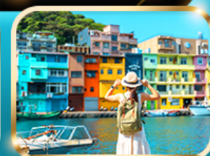
หมู่บ้านประมงเจิ้งปิ่น