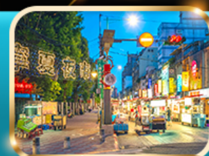
หนิงเซี่ย ไนท์มาร์เก็ต