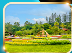
สวนบ้านปรน.เจียงไคเช็ก