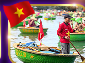
เรือกระด้ง หมู่บ้านกิมทาน