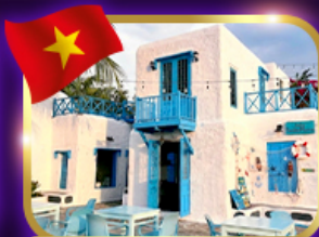
คาเฟ่สุดชิค ซานทรา มารีน่า