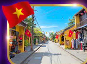
เมืองท่ามรดกโลก ฮอยอัน