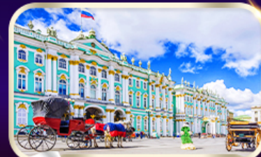
พิพิธภัณฑ์ฮอร์มิก้า