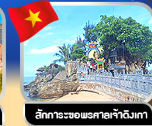
ลัทธิกระซอพรตเจ้าฉางเม้า