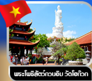
พระโพธิสัตว์กวนอิม วัดโหลก๊ก