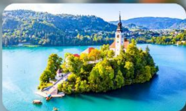
โบสถ์พระแม่มาเรียแห่งเบลค