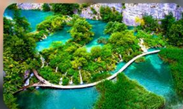
อุทยานแห่งชาติพลิตวิเช่