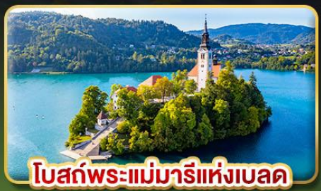
โบสถ์พระแม่มาเรียแห่งบลัด