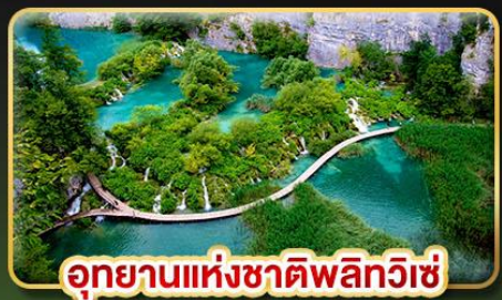
อุทยานแห่งชาติพลิตวิเช่