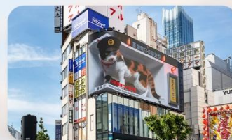
ซูปป์ิงชินจุกุ