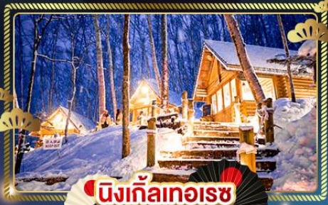
นิงเกิ้ลทอริช