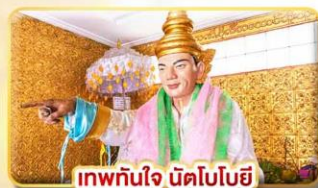
เทพทันใจ นัตโอบอโย