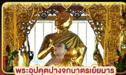
พระอุปคุตปางจกบาตรเขี้ยวมา