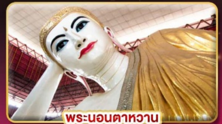
พระนอนคาทาว