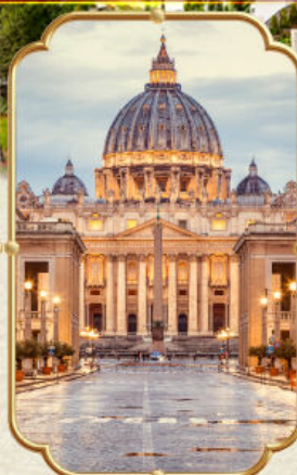
มหาวิหารเซ็นต์ปีเตอร์