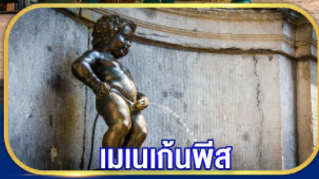
เมเนกันพีส