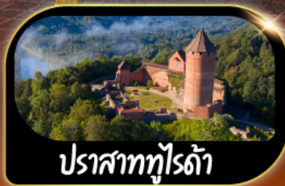
ปราสาททุไรดำ

GO3HEL-EK001 28 ธ.ค.69 - 07 ม.ค.70 เทศกาลปีใหม่