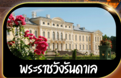
พระราชวังรันดาค