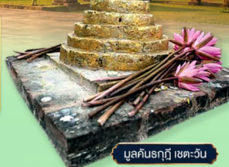
มุลคินรฤฎี เขตตะวัน