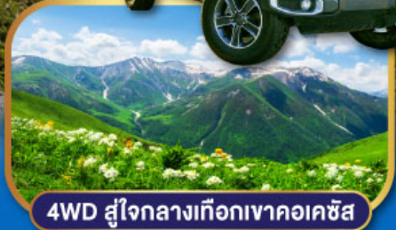
4WD SUV ใจกลางเทือกเขาคอเคซัส