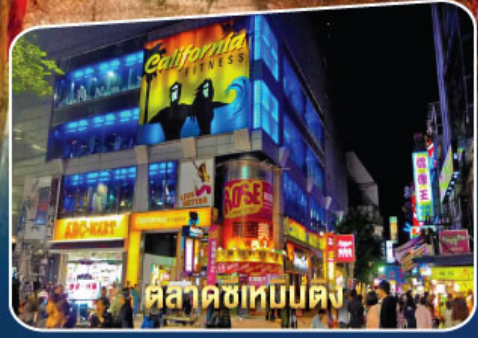
ตลาดซีเหมินตง