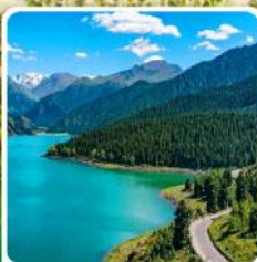
อุทยานเทียนชาน เทียนฉือ