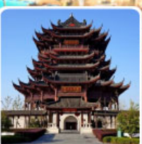
วัดหลงหยวน