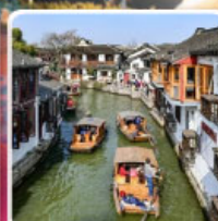
หมู่บ้านโบราณจูเจียเจี๋ย