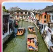
หมู่บ้านโบราณจูเจียเจี๋ย