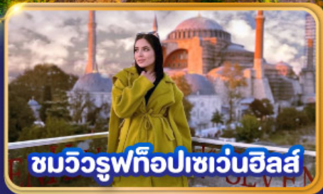
ชมวิวยูฟทีโอปเซเวนฮิลส์