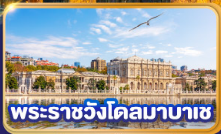
พระราชวังโดลมาบาซ