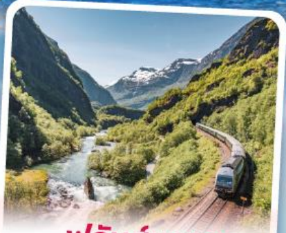
พหลิมส์บานา รถไฟเส้นทางสายโรแมนติก