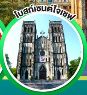
โบสถ์ซันต์โจเซฟ