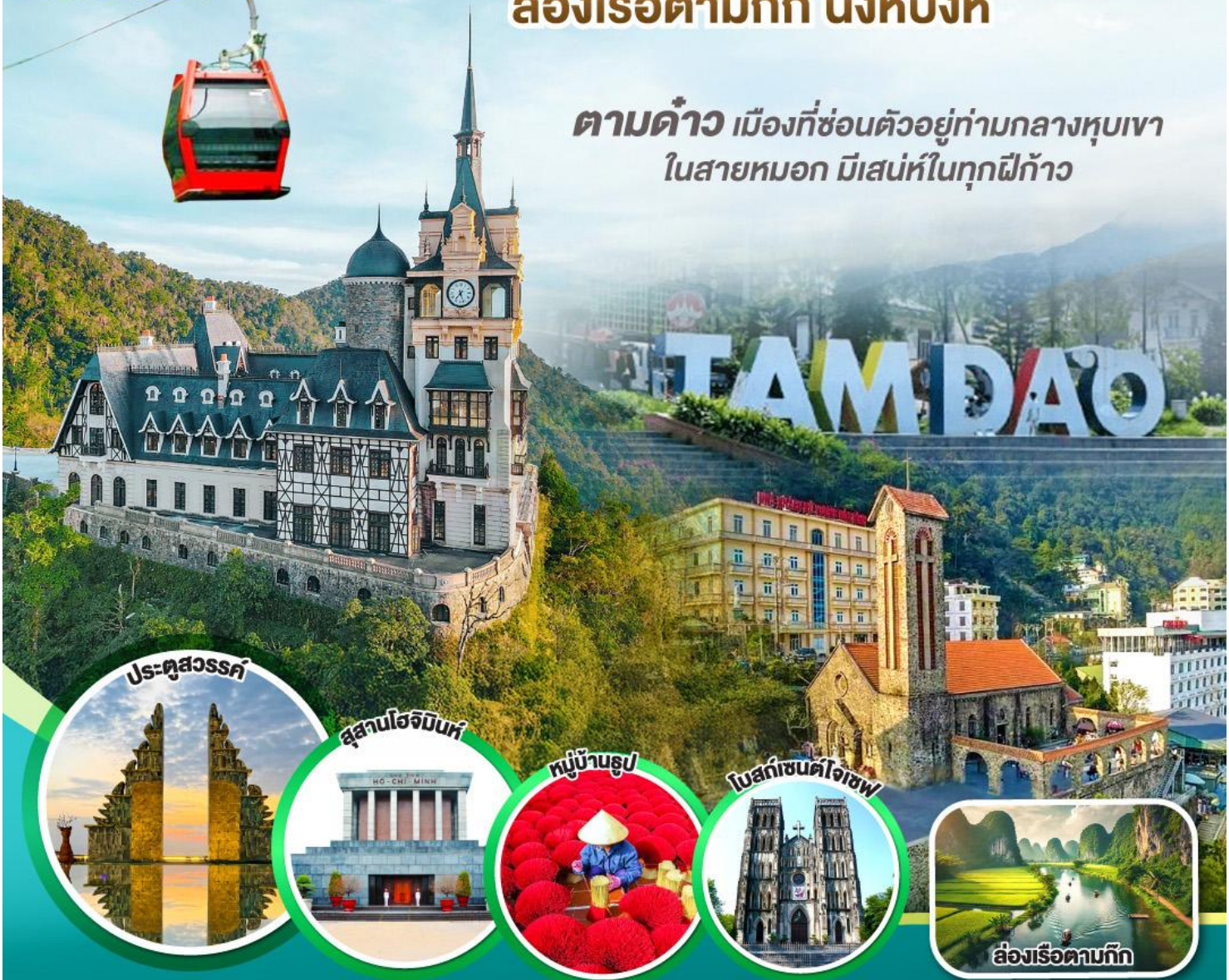
ประตูล้อมรั้ว

ตามคำ เมืองที่ซ่อนตัวอยู่ท่ามกลางหุบเขา ในสายหมอก มีเสน่ห์ในทุกฝีก้าว