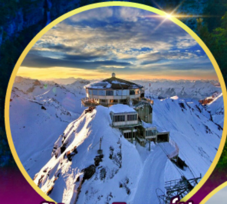
ยอดเขาซิลรอร์น