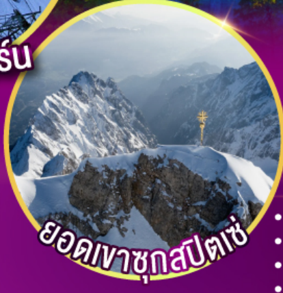
ยอดเขาชุกสปีตเซ