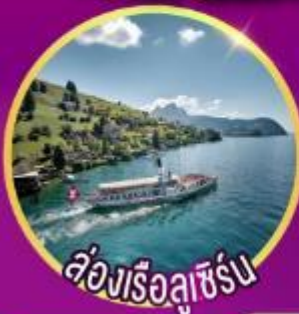
ห้องเรือลูเซิร์น