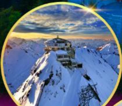
ยอดเขาซิลรอร์น