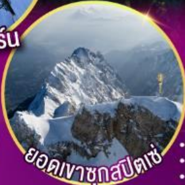
ยอดเขาชุกสปีตซ์