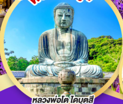
หลวงพ่อโต ไคบุตสึ