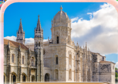
มหาวิหารเจอโร นีโม