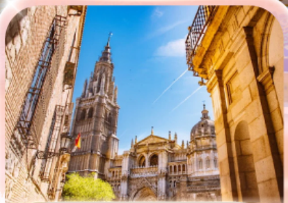
มหาวิหารแห่งโกเอลโด