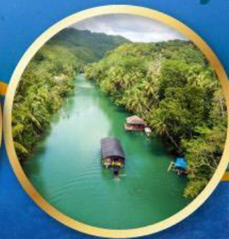
ส่องเรือแม่น้ำโลบ็อก