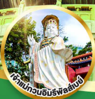
เจ้าแม่กวนอิมรับพลังบ่อ ขอพรรับพลังงานดี เสริมพลังดวงจัญ