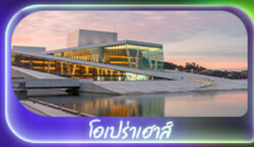
โอเปร่าเฮาส์