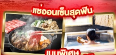
เขื่อนเซ็นสุคฟิม

✈️ สายการบิน AirAsia X (XJ) น้ำหนักกระเป๋า 20 KG