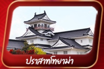
ปราสาทโทยาม่า