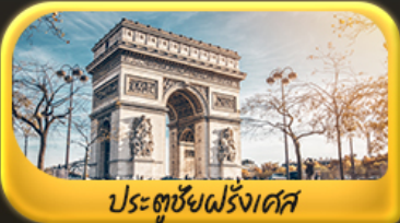
ประตูชัยฝรั่งเศส

พิเศษ!! ล่องเรือแม่น้ำแซนชมเมือง โดย บาโด มูช