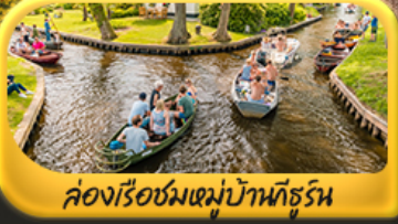
คลองเรือชมหมู่บ้านกังหัน