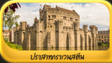
ปราสาทราวาสติน