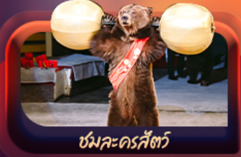
หมีละครสัตว์