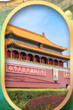
จัสดริสเทียนอันเหมิน