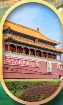
จัสมตรีสเทียนอันเหมิน