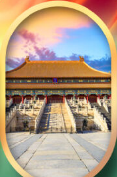
พระราชวังกุ๊กง