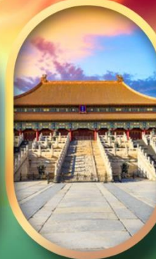
พระราชวังกุ๊กง