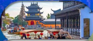
Zhujiajiao Ancient Town ส่องเรือเมืองโบราณ

เชียงใหม่ ดิสนีย์แลนด์ เมืองโบราณจูเจียเจียว