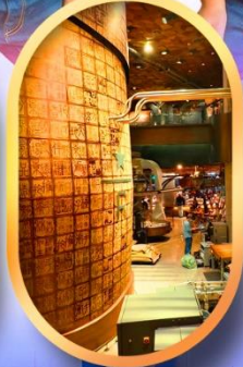
ร้านสตาร์บัคส์