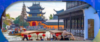
Zhujiajiao Ancient Town ล่องเรือเมืองโบราณ

เซี่ยงไฮ้ ดิสนีย์แลนด์ เมืองโบราณจูเจียเจียว