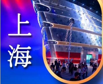
เรืออะทลันติก