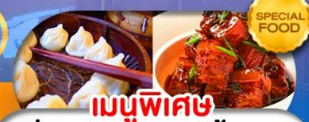
เมนูพิเศษ เสี่ยวหลงเป่า หมูน้ำแดง เดินทาง ต.ค. 69 - มี.ค. 70