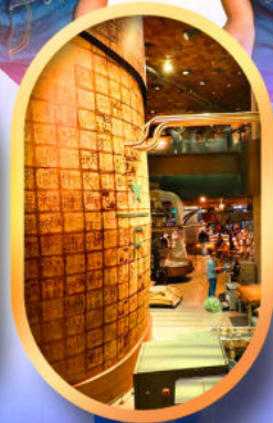
ร้านสตาร์บัคส์