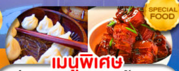
เมนูพิเศษ เสี่ยวหลงเปา หมูน้ำแดง เดินทาง ต.ค. 69 - มี.ค. 70