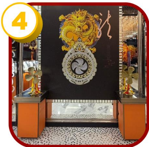
ศูนย์ฮวงจู้กั๊กหัน