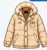
เสื้อโค้ทกันหนาว ตัวหนา