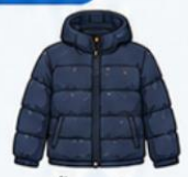
เสื้อขนเป็ด