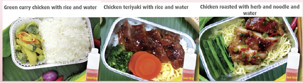
Green curry chicken with rice and water

*** เมนูอาหารอาจมีการเปลี่ยนแปลง ทั้งนี้ขึ้นอยู่กับเที่ยวบิน ***