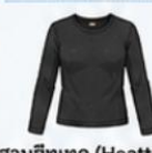
สวมฮีทเทค (Heattech) แบบหนาพิเศษด้านใน