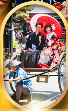
เมืองเก่ากาคายาม่า