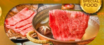
พิเศษเมนู บุฟเฟต์ชาบู