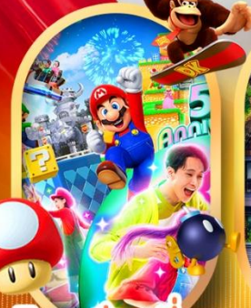
อิสระท่องเที่ยว หรือเลือกซื้อทัวร์เสริม USJ