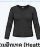
สวมฮีตเทค (Heattech) แบบหนาพิเศษด้านใน