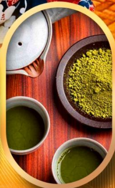
ชงชาแบบญี่ปุ่น