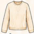
เสื้อแขนยาว