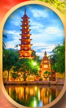
วัดเงินทึง