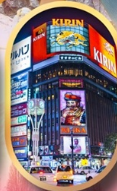
ช้อปปิ้งย่านซูซุกิโนะ