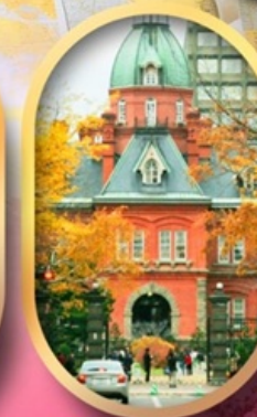
ศาลาว่าการเก่า