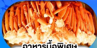
อาหารมือพิเศษ บุฟเฟ่ต์งาปู