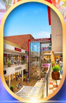
มิตซุยเออากิเส็ต