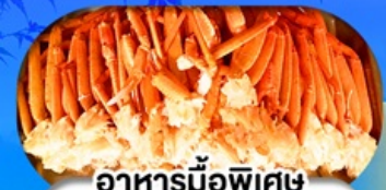
อาหารมือพิเศษ บุฟเฟ่ต์ขาปู