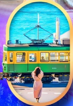
ถนนโคมาจิโดริ