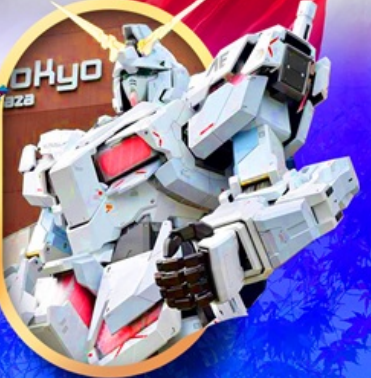
ห้างไอโดะบะกันดั้ม