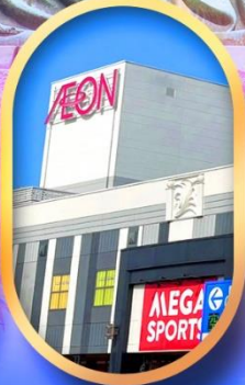
อีออนมอล