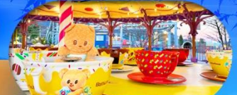
Fuji Q Highland x Butterbear เดินทาง พ.ศ. 69 เป็นต้นไป