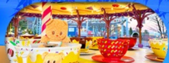
Fuji q Highland x Butterbear เดินทาง พ.ค. 69 เป็นต้นไป