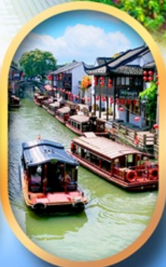
ถนนชานกิงเจีย