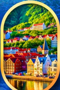
พิกเมืองเบอร์เก้น