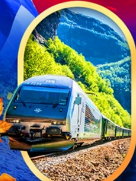
รถไฟฟลิมส์นา