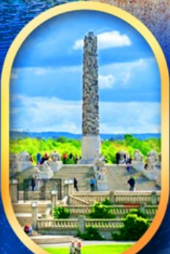
วิกเกอร์แลนด์