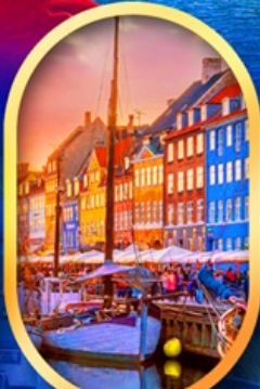
ท่าเรือฮานน์