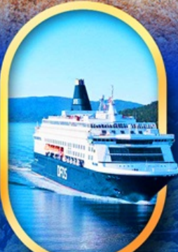
นั้งเรือ DFDS