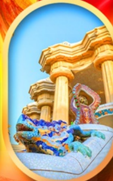
ปาร์ก กูเอล