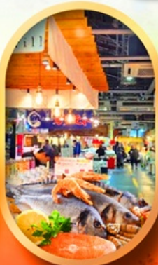
ตลาดปลาฮิองโศ