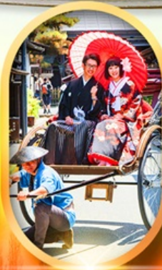
เมืองเก่าทาคายามา