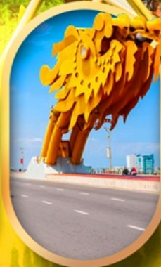
สะพานมังกรดามิง