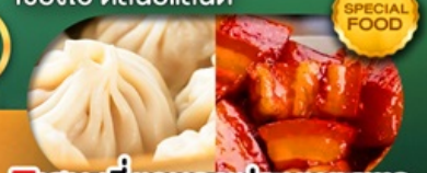
พิเศษ เสี่ยวหลงเป่า หมูตงพอ เดินทาง ม.ค. - มิ.ย. 69